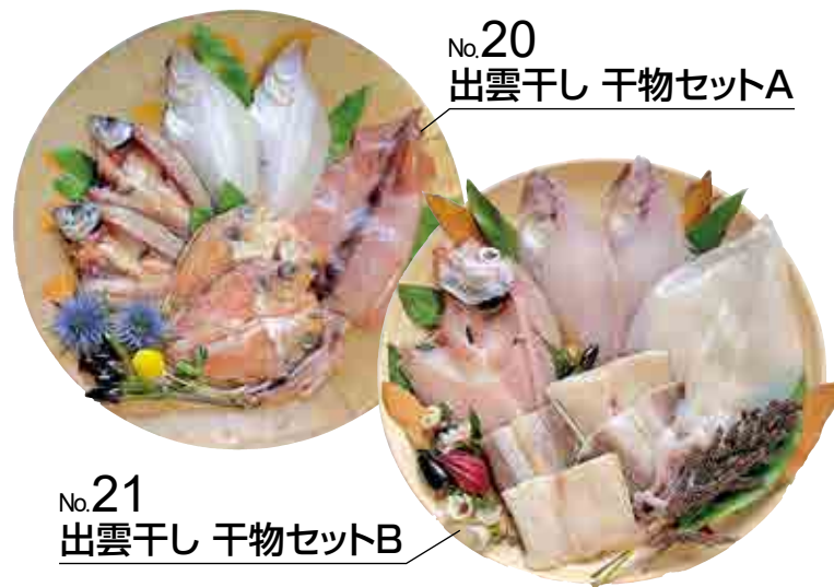
No.20 出雲干し 干物セットA

山陰を代表する海の幸を、お歳暮や贈り物にどうぞ。 出雲の干物で体の中から美しく。