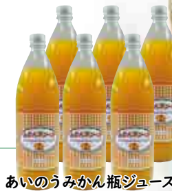
あいのうみかん瓶ジュース

大阪府・和歌山県産の有機温州みかん100%。ストレート製法で絞った美味しい果汁なので、みかんの自然な香り・甘味・酸味がいきています。